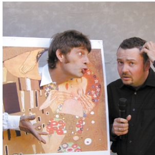
Der Kuss von Gustav Klimt