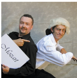
Mozart direkt aus dem Musical