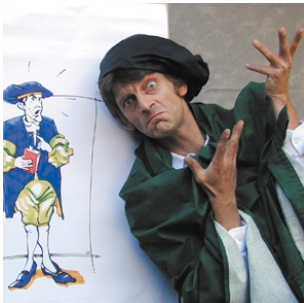
Karl, der V., echauffiert über seine Noch-Nicht-Krönung