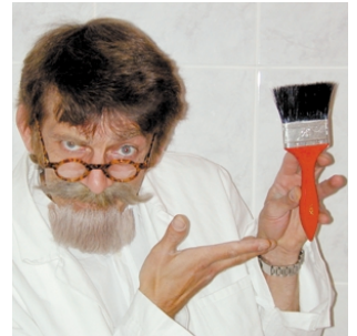
Dr. Sigmund Freud mit Beweisstück