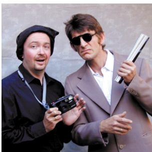
Besucher und Security bei Cezanne