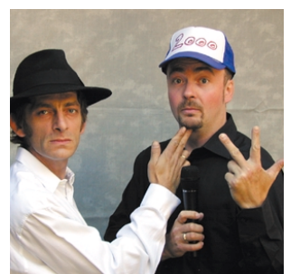
Harry Lime, fast gefährlich