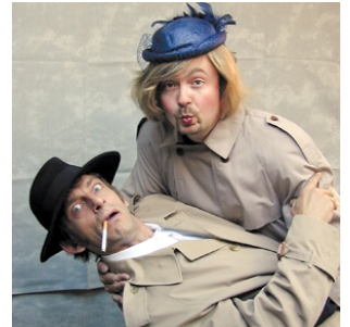
Ingrid in love with Humphrey