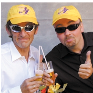
Cocktailschwinger, die SommerSzene promotend