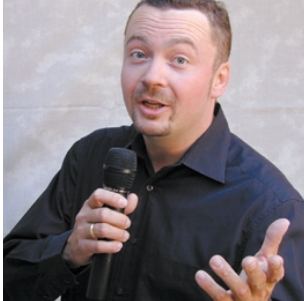
Moderator und Sänger

In der Folge möchten wir einige der in der Zeitdauer der gespielten Shows plazierten Mitwirkenden vorstellen: