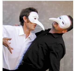
Tänzer, vibrierend und avantgardistisch