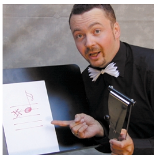
Dirigent im Haus der Musik