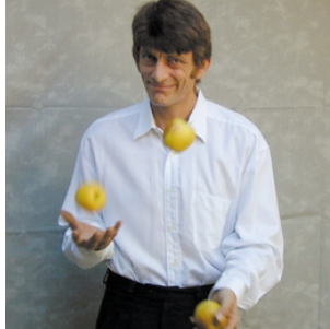
Jongleur und Pantomime